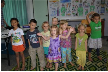
De meisjes op de HomeSchoolWeek