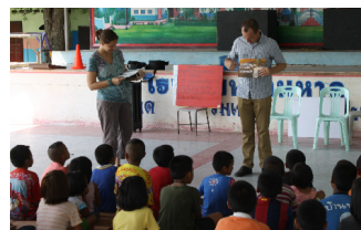
De kinderen leren een Bijbelvers tijdens de 3 Day Club