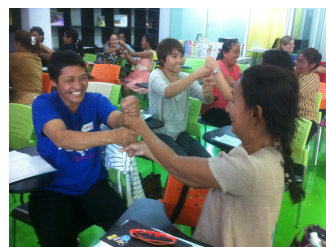
Enthousiaste deelnemers van de cursus kinderwerkers