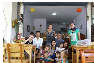
Ontmoeting met Thaise christenen op Koh Chang

Deze man bleek getrouwd te zijn met een Isaanse vrouw, die we druk bezig zagen in de keuken. Nadat we gebeden hadden voor het eten, snelde ze op ons af: 'Zijn jullie ook christen?!' Zelf bleek ze al 7 jaar christen te zijn (haar man niet). Tijdens het gesprek vertelde ze dat ze al jarenlang bidt voor een kerk in haar geboortedorp, zodat haar familie ook bereikt kan worden. Groot was onze verbazing toen bleek dat haar geboortedorp slechts 10 km van ons dorp ligt! (Isaan is 5 x zo groot als Nederland). Ze sloeg zelfs haar handen voor haar gezicht toen we haar vertelden van de kleine groep christenen die elke week in haar geboortedorp bij elkaar komt. Er zijn zelfs plannen om hier binnenkort een kerk te openen. Voor haar werd meteen duidelijk dat dit geen toevallige ontmoeting was. De zondag erop waren we aanwezig bij de Thaise kerkdienst in haar huis. Zowel voor hen als