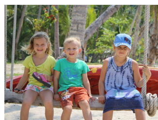
Heerlijk een weekje vakantie!

Bid voor de kinderen die naar de kinderclubs komen