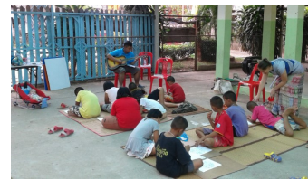
Kinderclub in Baan Naa Waa